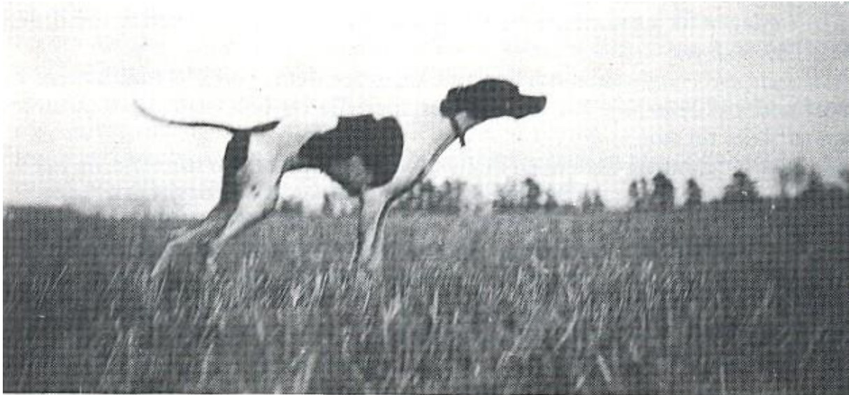
Ch. Torntoft Zita.